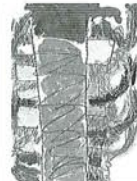
優秀賞「大火勢」 幼稚園: 坂向 野々