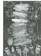
優秀賞「大火勢と花火」 保育園: 木村 龍