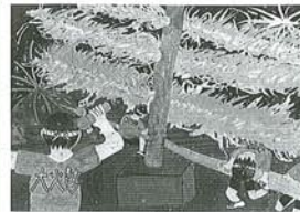
最優秀賞「大火勢」 小学6年生: 永井 海里